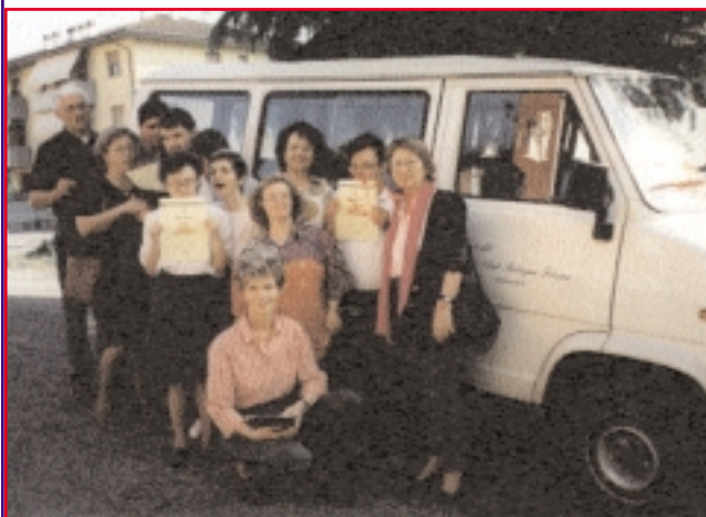
I ragazzi di un laboratorio con il nostro pullmino